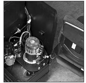
Auki käännettävä huoltoluukku