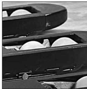
Pyöristetyt haarukan piikit