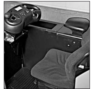
Ergonominen kuljettajan tila