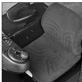
Täysin säädettävä istuin

Jatkuva kehitystyömme voi aiheuttaa muutoksia näihin teknisiin tietoihin.