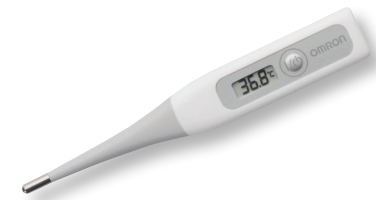
FLEXT TEMP SMART